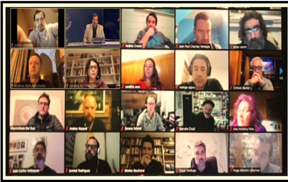
SANTIAGO DE CHILE, JULIO 2020. WWW.ANAGEC.CL