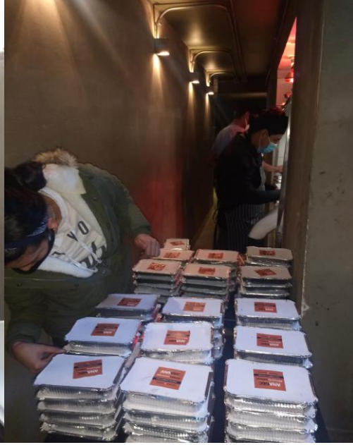
SANTIAGO DE CHILE, JULIO 2020. WWW.ANAGEC.CL